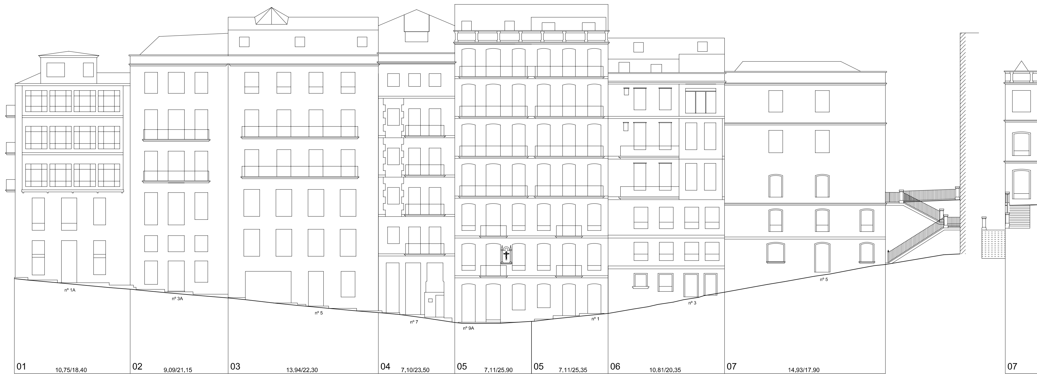
Rúa Alta-Rúa San Xulian

Nº PARCELA FRENTE PARCELA/ALTURA DE CORNIXA (COTAS EN METROS)